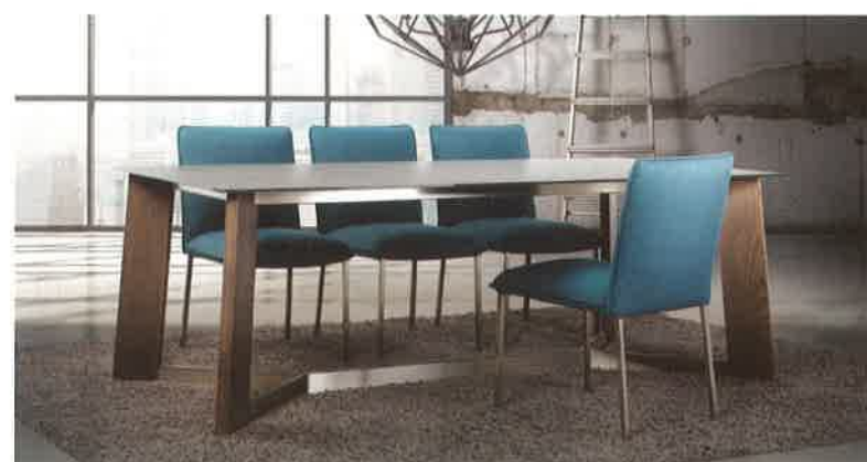
L'ORIGINALITÉ DE TRICA