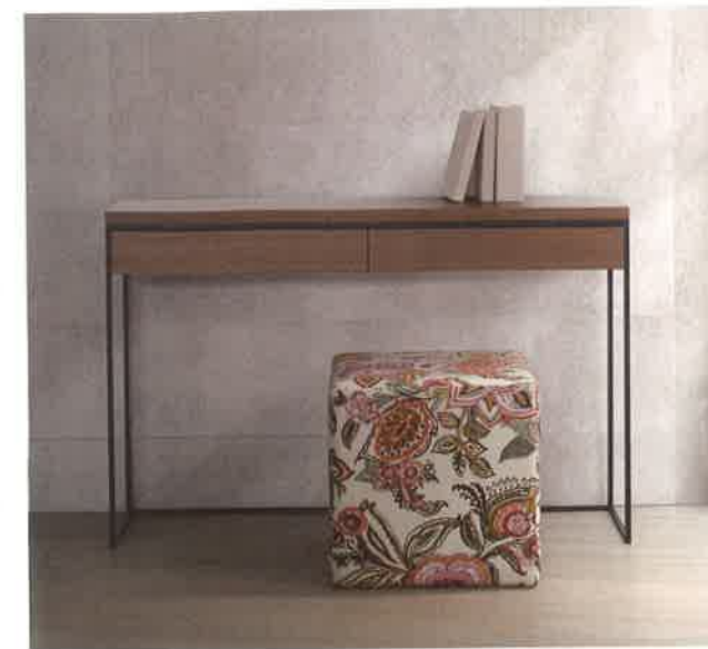
Trica - Console Mix It Up

Les lignes droites et épurées des meubles ont contribué à créer le look scandinave recherché par la designer pour son caractère sobre. Cette sobriété se reflète dans les couleurs des tissus de recouvrement, comme le gris olive du canapé modulaire. Dans cet espace chaleureux, les murs clairs deviennent la galerie idéale pour mettre en valeur un luminaire ou l'œuvre d'un artiste québécois, et composent un cocon dans lequel il fera bon vivre.