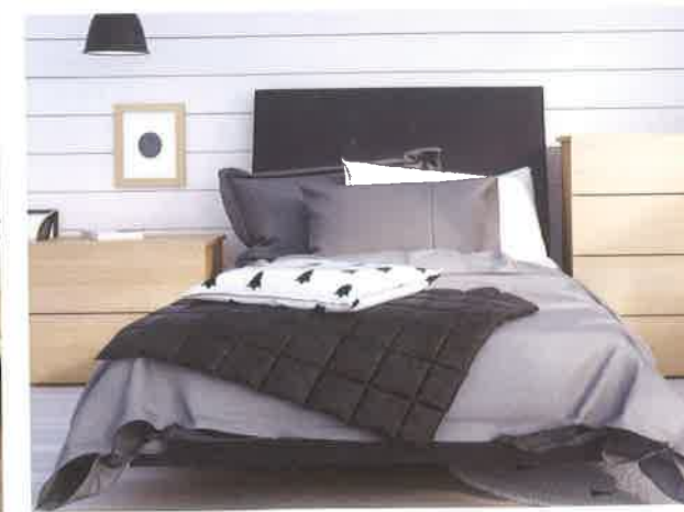
Nexera - Collection Karla