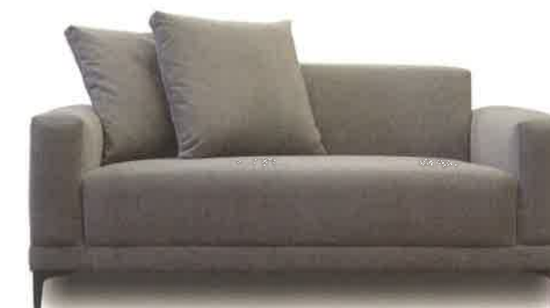
G.Romano – Causeuse Silvi