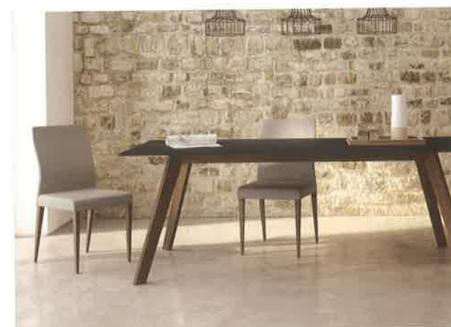
Mobicam - Collection Dolci

Sarah Paradis, Humà Design + Architecture 514 274-3883 • info@humadesign.com