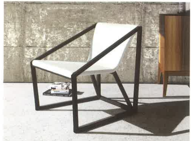
Huppé – Fauteuil Kite, gamme Up