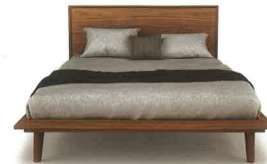
Huppé – Collection Herman, gamme Up

Conçues pour les familles, mais convenant à tous les âges, les maisons de ville superposées de Highlands LaSalle s'élèvent sur deux niveaux. L'unité du bas, d'une superficie d'environ 1200 pieds carrés, inclut trois chambres à coucher, deux salles de bain et une grande terrasse de 420 pieds carrés. L'unité du haut, légèrement plus vaste avec ses 1500 pieds carrés, comporte quatre chambres à coucher, deux salles de bain et un balcon de 170 pieds carrés. Sans compter les nombreux rangements qui facilitent l'existence.