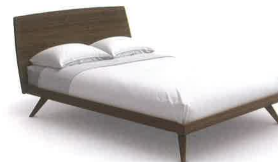
Mobican - Lit Zenia