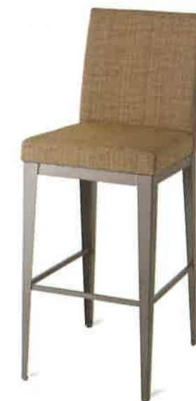
Amisco - Tabouret Pablo

Pour la designer, le choix de meubles québécois s'imposait, ceux-ci renvoyant aux racines mêmes de l'édifice patrimonial, tout en soulignant sa modernité de leurs lignes sobres et minimalistes. Ce qui fait du Conservatoire une réussite sur tous les plans!