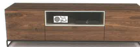
Huppé - Meuble audio de la collection Linea, gamme Up

Josée-Anne Gagné Foti Drouin fotidrouin.com