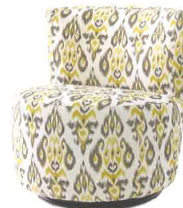
Jaymar – Collection Classique, fauteuil pivotant 503

514 941-2201 • jenbclermont@videotron.ca