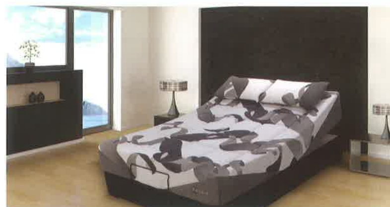
L'INNOVATION DE ZEDBED