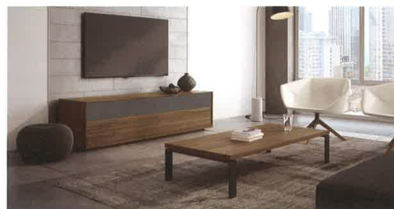
LE RAFFINEMENT DE MOBICAN