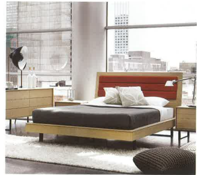
Mobican – Lit Ophelia avec tête rembourrée